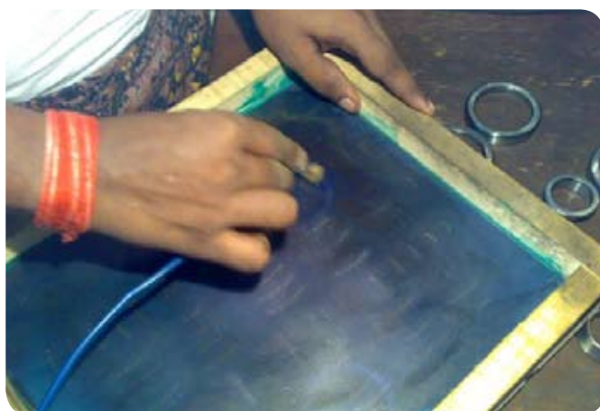
Padělané značení je vyleptáno na ložisko pomocí síťotiskové šablony