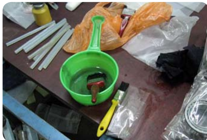
Typické nástroje používané v padělatelské dílně

Místo abyste získali výrobek špičkové kvality, pořídíte si padělek za cenu, která v žádném případě neodpovídá tomu, co výrobek skutečně nabízí.