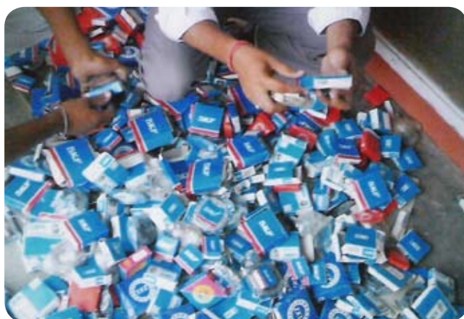
Padělaná ložiska zabavená při policejní razii